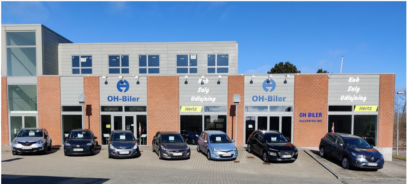
1. sal 240 Kvm.