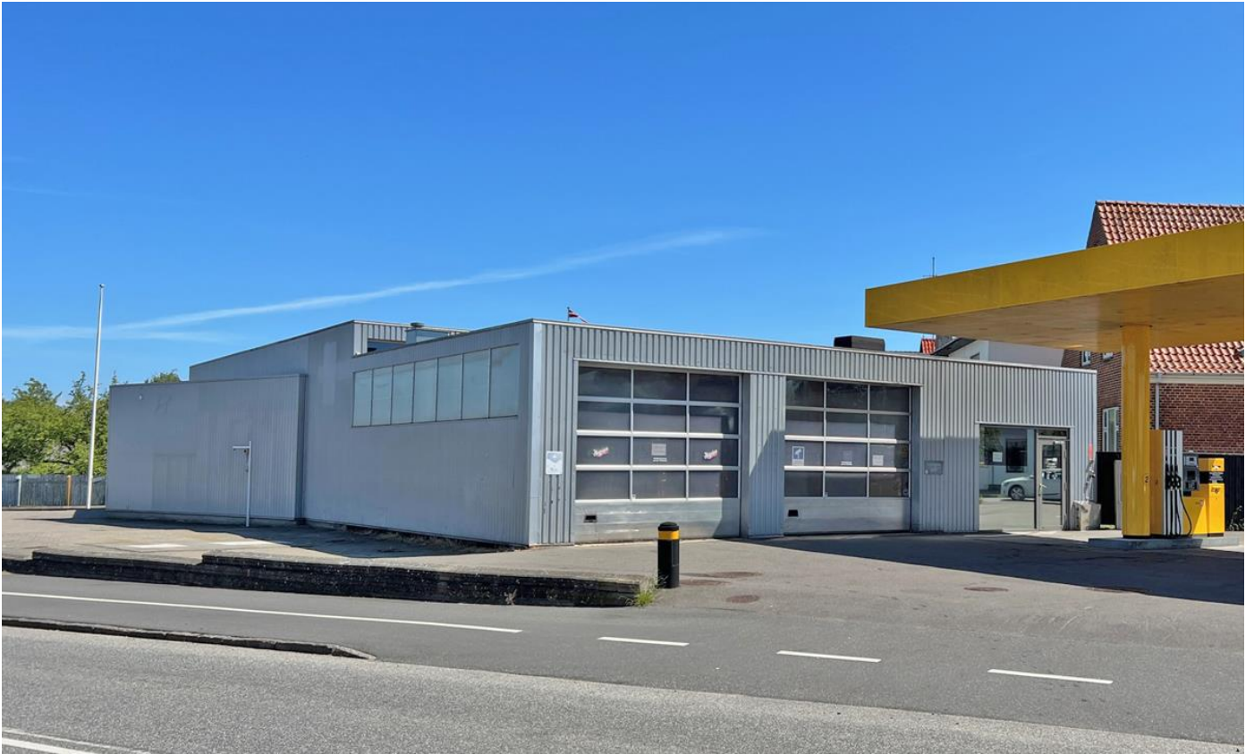
Servicecenter Brovej 41, 4930 Maribo