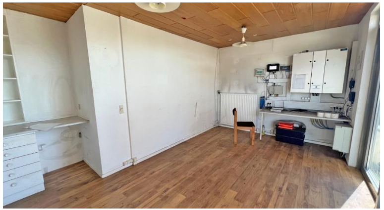
Teknik- & Indtjekning