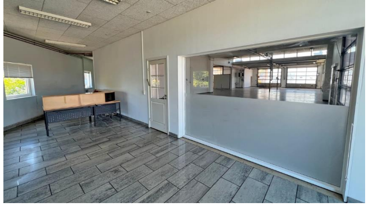
Kontorområde – med vindue til værksted