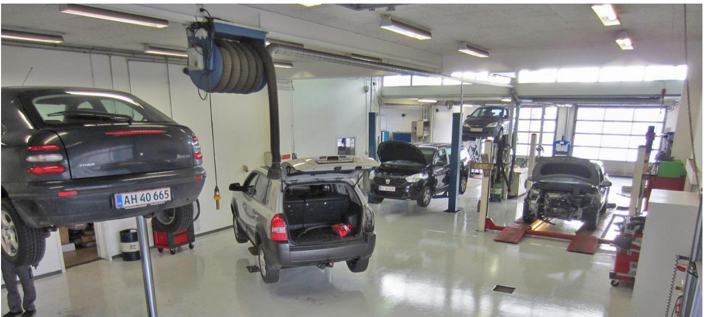
Værksted: 310 Kvm.