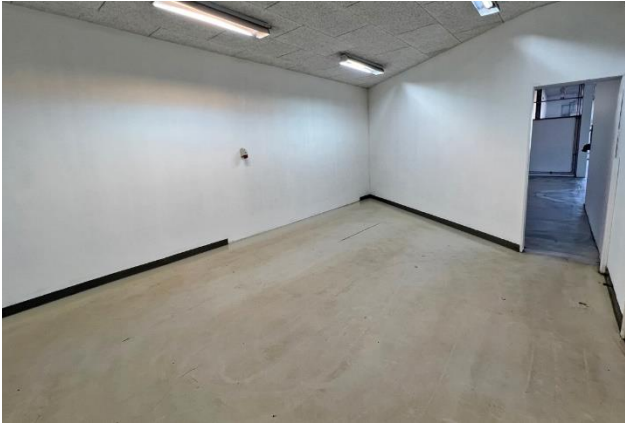
Lagerrum: 30 Kvm.